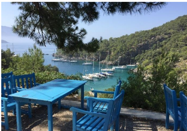
Cold Water Bay, Fethye

Preise sind jeweils auf der Basis von 6 resp. 4 Gästen an Bord, inkl. Skipper und Treibstoffanteil – die effektiven Kosten sind abhängig von Saison und Fahrstrecke.