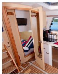
Blick in die Gästekabine