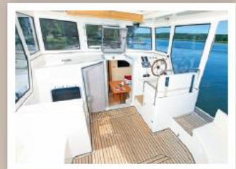
Überdachter, verschließbarer und beheizbarer Steuerstand