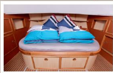
Vorschiffskabine mit Doppelbett