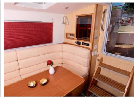
Salon mit Niedergang