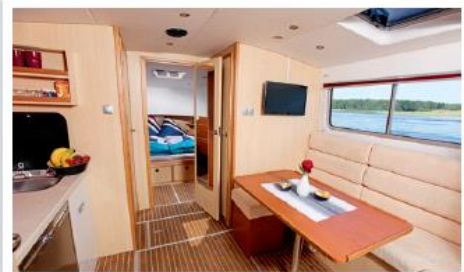
Salon mit SAT-Multimedia-Center

Abbildungen des Prototyps beispielhaft, Abweichungen möglich